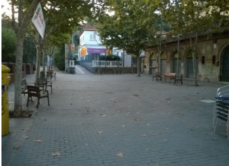
Plaça Miquel Ros